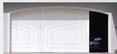
Exemple de fraisage + laquage 1 couleur

Réalisez le motif de votre choix grâce au fraisage (avec l'option feuille extérieure en aluminium de 3 mm).