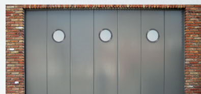
Exemple de hublots ronds